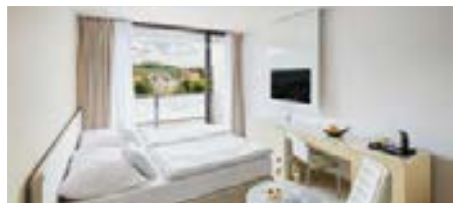
Zimmerbeispiel Superiorzimmer City View